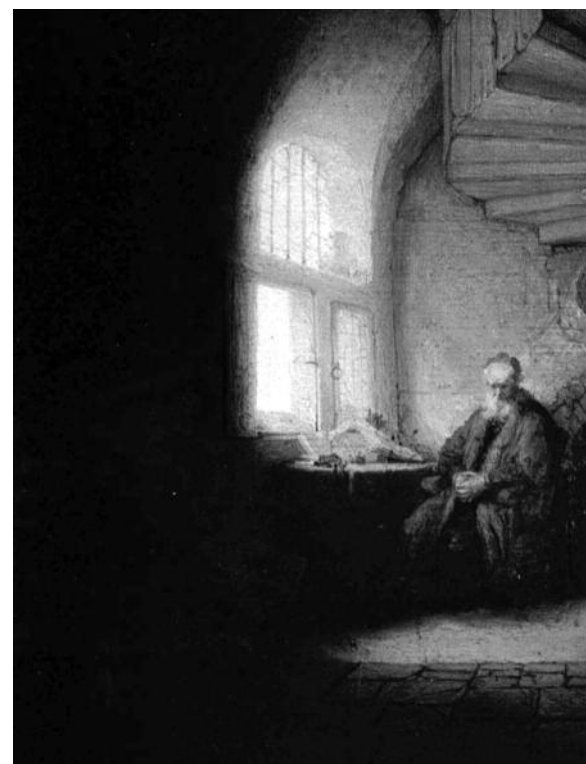
Selbstverwaltung im freien Geistesleben: Ausbildung einer Willensfrage innerhalb des Geisteslebens, kein Mangel des politischen Systems! Unsere Gesellschaft ist zu tiefst traditionellen Vorstellungen verhaftet: Bevor jemand seine Tätigkeit in Selbstverwaltung nimmt, versichert er sich erst einmal, ob das auch erlaubt sei. Anders als unter staatlicher Bewilligung zu arbeiten, scheint vielen Menschen gar nicht denkbar.»

Freies Geistesleben ist selbstbestimmtes Geistesleben. «Selbstbestimmt» aber ist mehr als nur «staatsunabhängig».