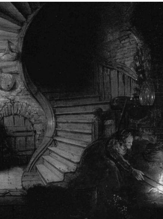
r inneren seelisch-geistigen Regsamkeit durch Studium

ten des freien Geisteslebens, sondern können als die Grundlagen des gesamten spirituellen Lebens angesehen werden.»